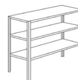
Almacenaje 15 hasta 25 °C

Todas las indicaciones se facilitan con buena intención. Las condiciones de empleo y los materiales son tan variables que nuestra experiencia nos aconseja se efectúen pruebas antes de iniciar un tiraje. NUESTRA RESPONSABILIDAD SE LIMITA AL CAMBIO DE LOS MATERIALES SUMINISTRADOS POR NUESTRA EMPRESA.